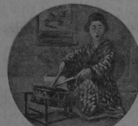
Sabe hacer producir armoniosos sonidos á los instrumentos más ordinarios como el taiko

En la única «Ciudad sin noche» que subsistía en los estados del Mikado, uno de los barrios especiales en el que vivía y se aglutina toda una población de histriónes, mimos, bailarinas, bufones, músicos, etc. etc. Como es sabido, las mujeres en el país nipón llevan élite y uniformemente el kimono, especie de anguarina gris ó azul rayada. Las de la alta sociedad usan vestidos de crepé de China, gris ó beige, también de dibujo muy sencillo, y que por todo lujo no llevan más que las armas de sus propietarios. Solamente en el Yoshiwara es posible encontrar todavía la soberbia y pintoresca indumentaria de otros tiempos.