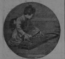
La música es uno de los postitempos favoritos de los geisha. Tocado el koto

Tras los sauces lirones de talla gigantesca que sombreaban la gran puerta, desplegábase una decoración de ensueño, surgía una visión inolvidable. Imaginosa una larguísima y ажурosa avenida bordeada por ambos lados por restaurante elegantes, casas de té, con sus fachadas llenas de linternas de seda luminosa... linternas de todos tamaños y formas y colores, azules, rojas, grises, verdes, etc.